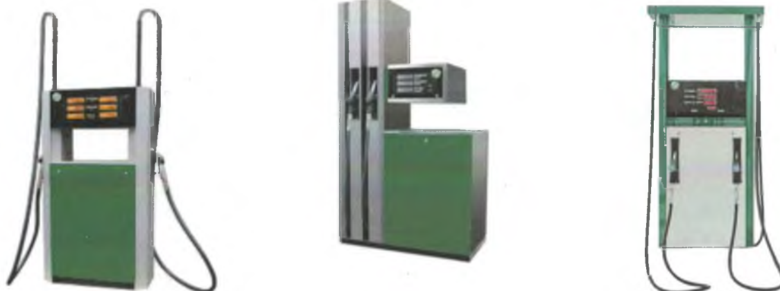
Рисунок 2 - Общий вид колонок