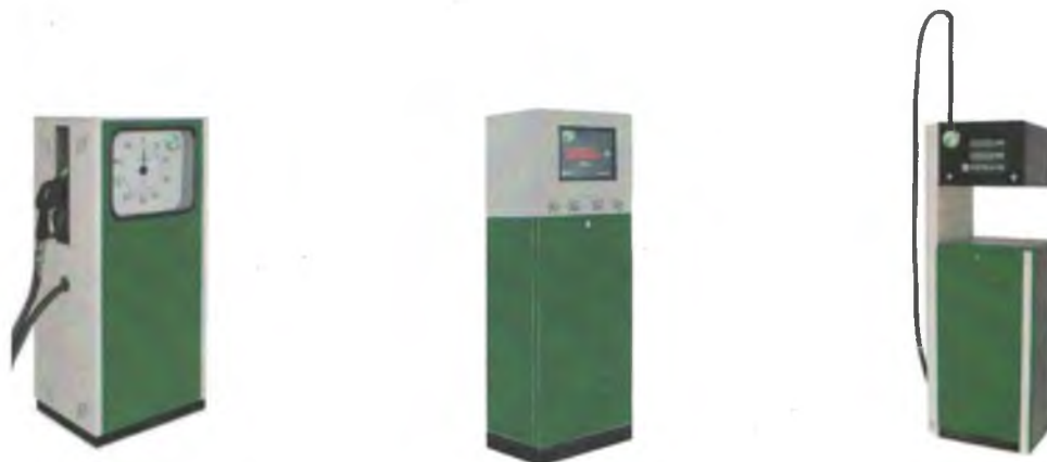
Рисунок 1 - Общий вид колонок

Схема пломбировки от несанкционированного доступа, обозначение места нанесения знака поверки представлены на рисунках 3 - 5.