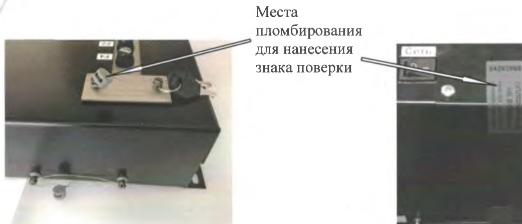
Рисунок 5 - Схемы пломбировки отсчетного устройства Север-4К и ЭКО и нанесения знака поверки